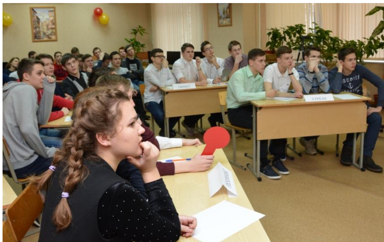
Студенты ОБПОУ «КЭМТ» на интеллект-шоу «Просто как дважды два»

Конкурс «Четвертый лишний» позволил студентам «расправиться» с лишними словами, числами, математическими обозначениями, приведенными в каждой строке.