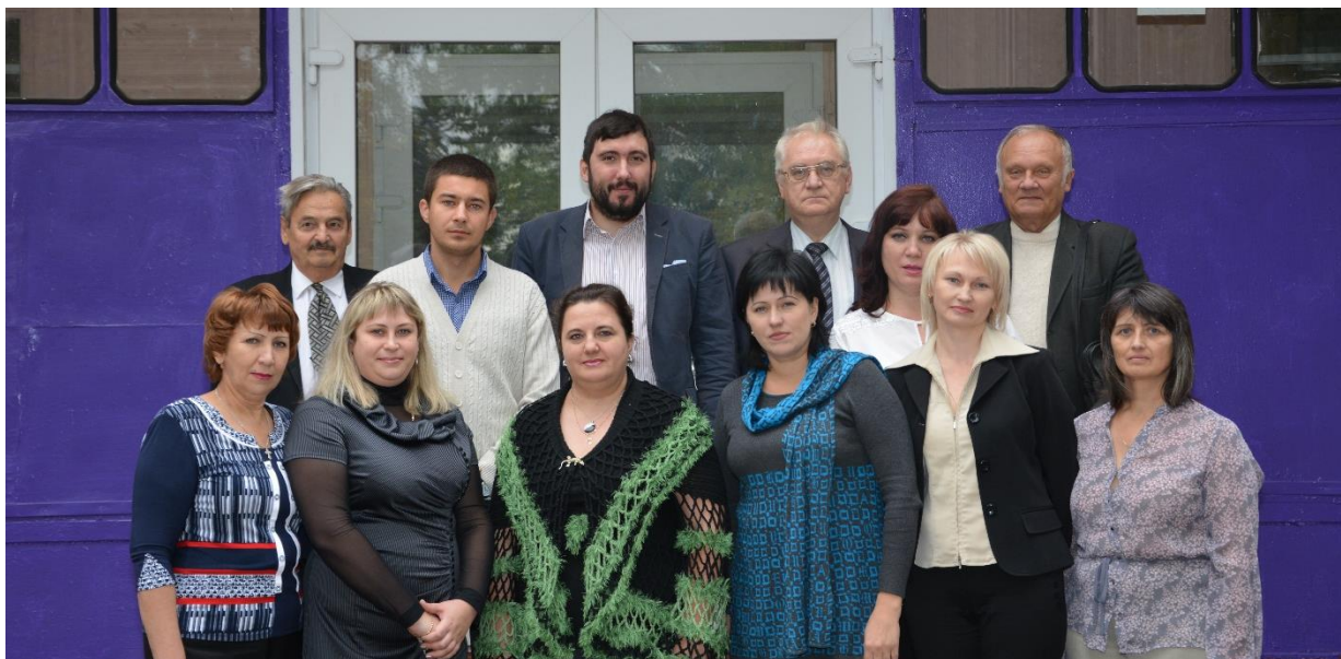
ПЦК преподавателей специальности «Компьютерные системы и комплексы», 2014 г.

ПЦК преподавателей специальности «Компьютерные системы и комплексы» Курского электромеханического техникума создана в 2004 году.