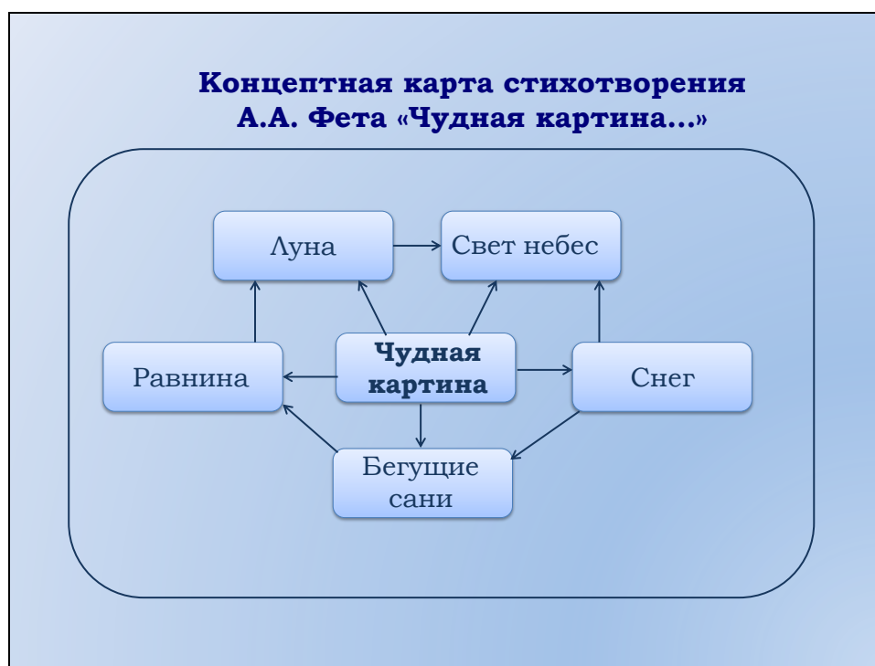
Рис. 1. Концептная карта стихотворения А.А. Фета «Чудная картина...»

Почему мой выбор пал именно на это стихотворение? Фета – его творчество – многие не понимали при жизни. Говорили, что его стихи представляют собой бессмысленный набор слов, поэты-сатирики не раз посвящали Фету свои эпиграммы и пародии. Но все это говорит о полном непонимании лирических принципов Фета. Предлагаю проследить своеобразную логику построения данного стихотворения, выполнив его концептный анализ. Итак, начнем. Я считаю, что вы без труда назовете основные концепты данного стихотворения (равнина, луна, свет небес, снег, бег саней). Изобразим их в виде схемы (рис. 1). Все это – родная для поэта картина.