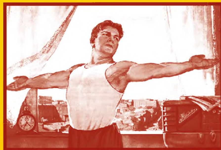
Ведите здоровый образ жизни