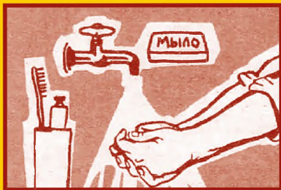
Регулярно мойте руки