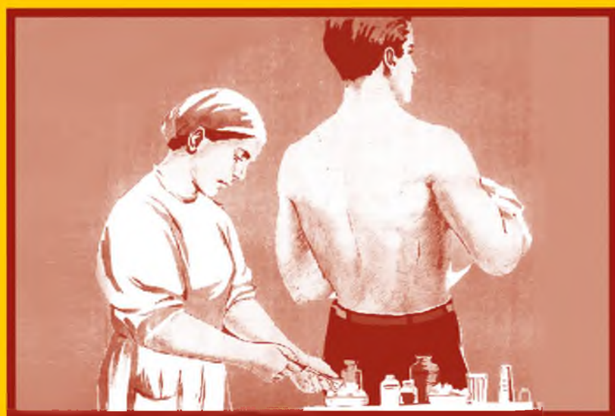
Сделайте прививку от гриппа