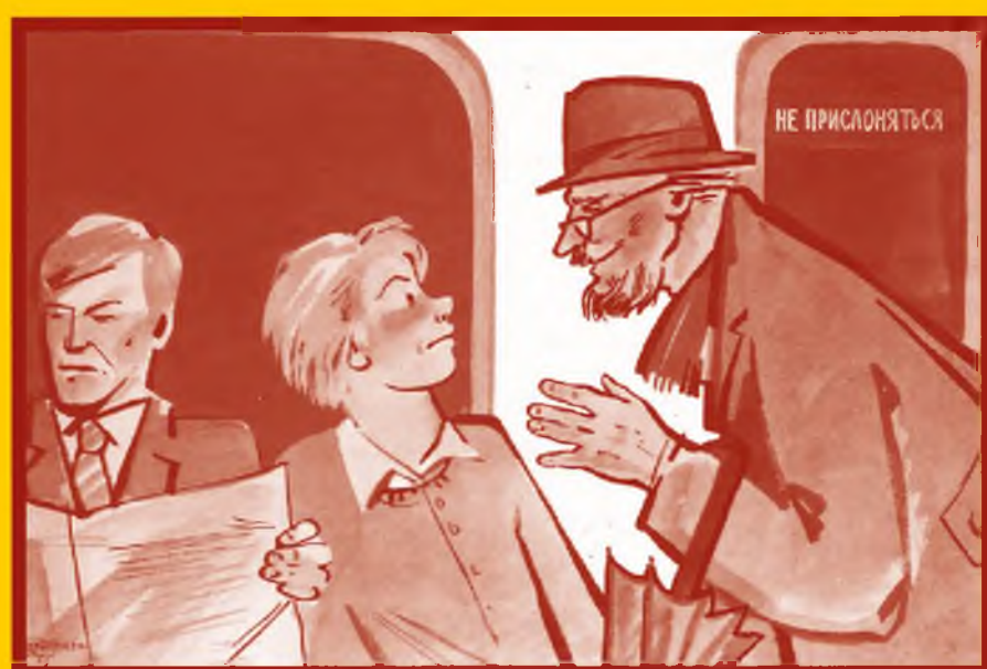
Ограничьте пребывание в местах скопления людей