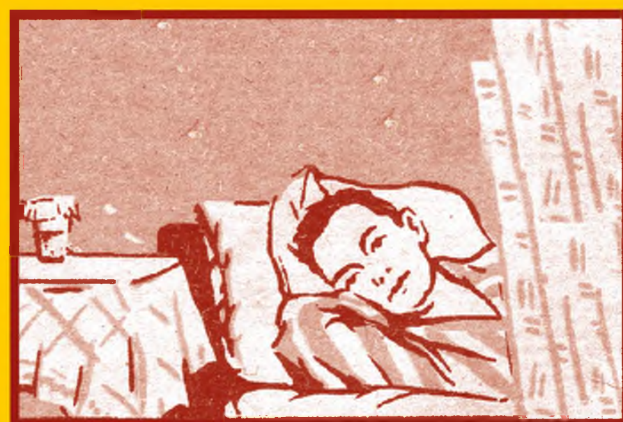
Избегайте контактов с заболевшими