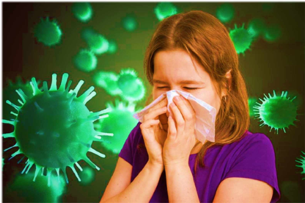
Как не заразиться