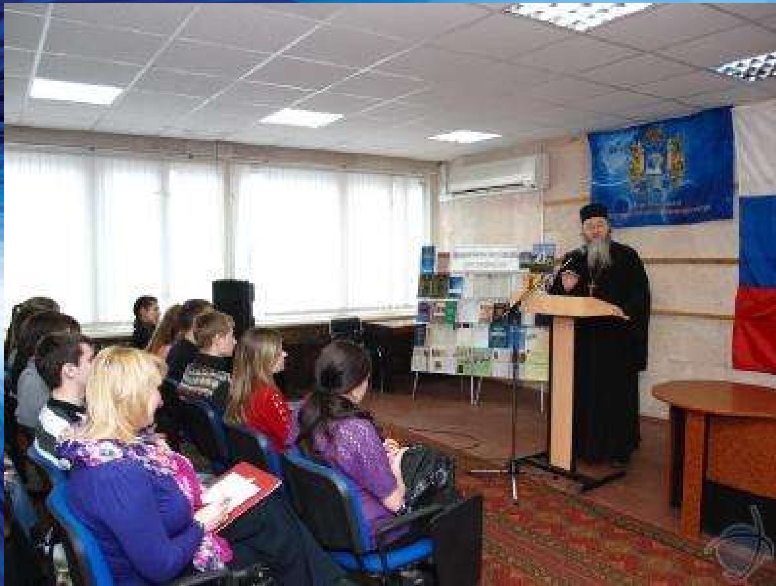
VII Всероссийские научно-образовательные Знаменские чтения