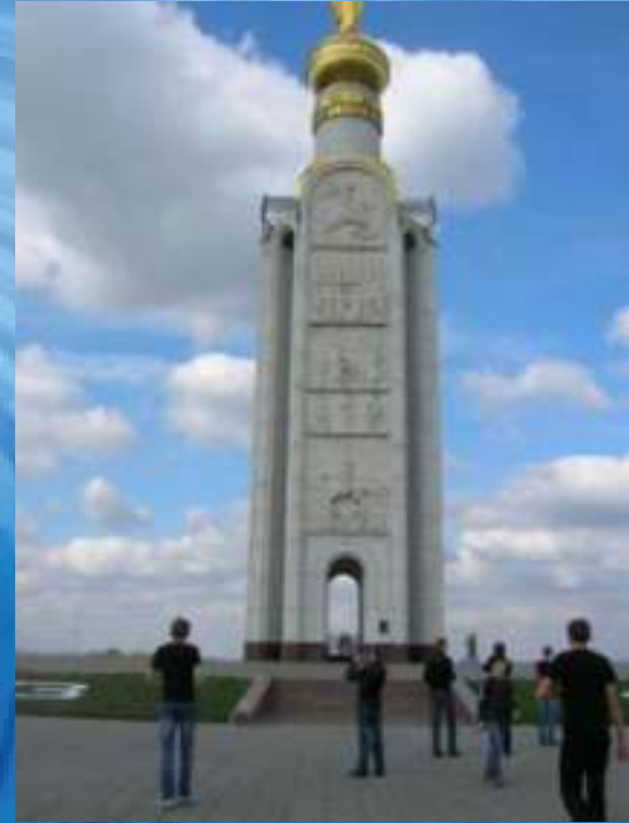
Южный Фас Курской дуги