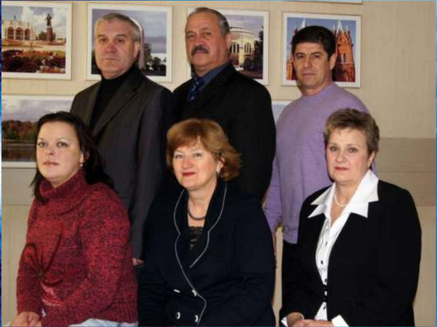
Кафедра преподавателей физического воспитания