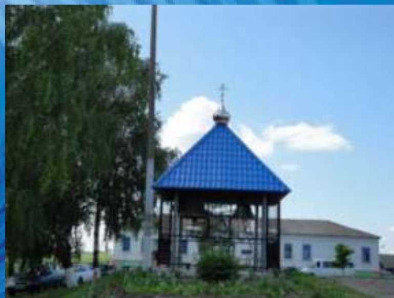
Горнальский Свято-Николаевский Белогорский мужской монастырь