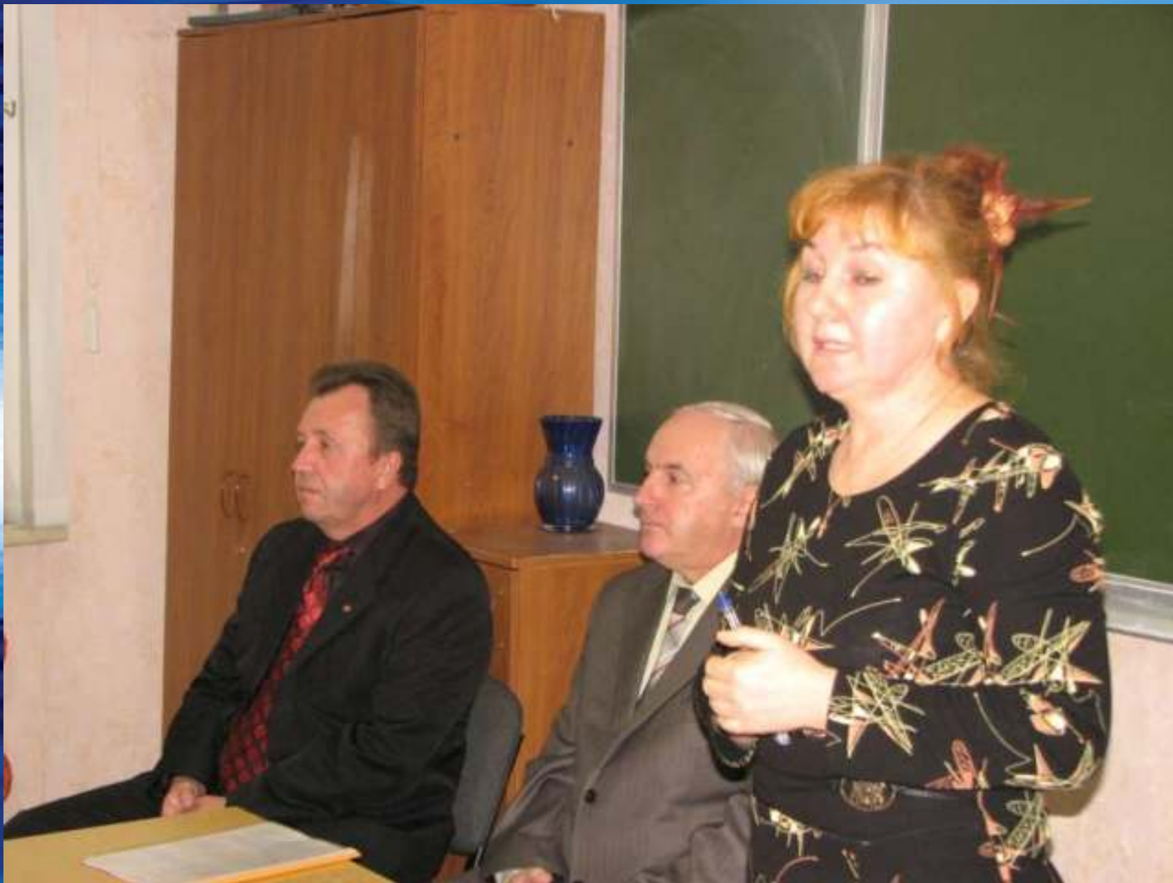
Совместное мероприятие с ДОСААФ