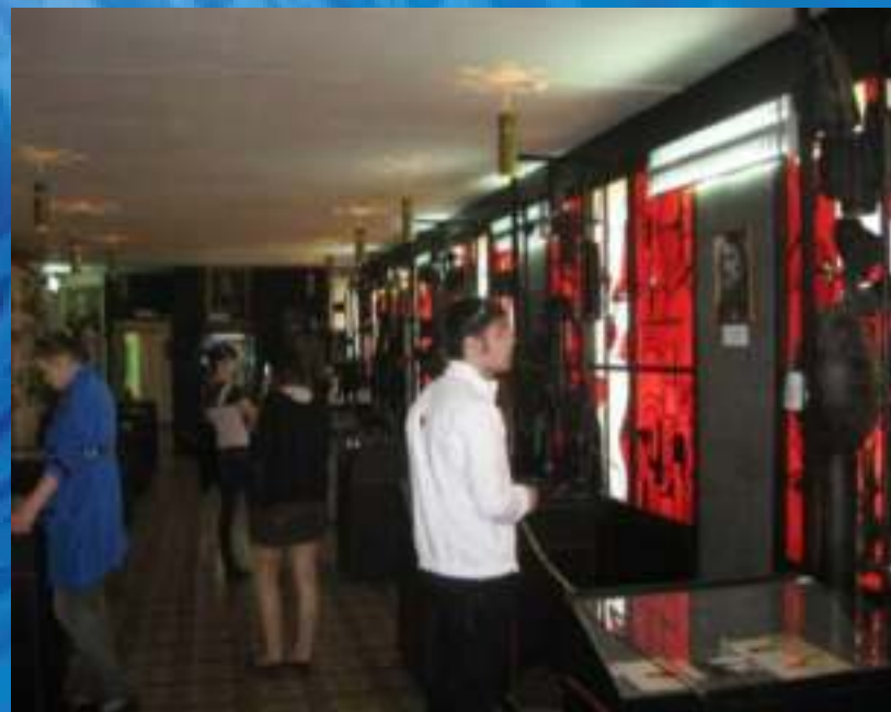
Экскурсия в поселок Поньри