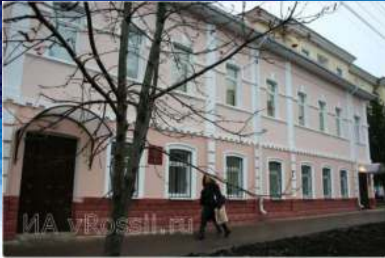
Курский литературный музей