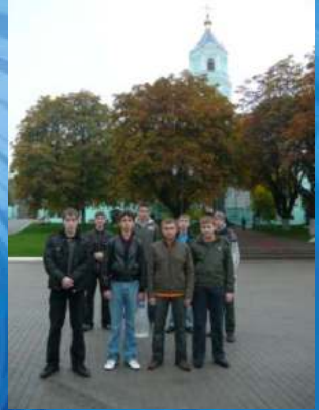
Экскурсия в Коренную Пустынь