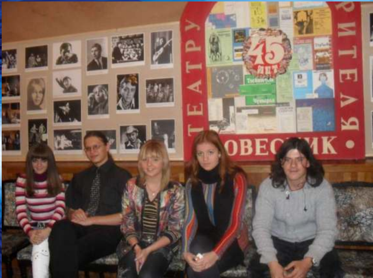
Наши студенты в Театре Юного Зрителя «Ровесник»