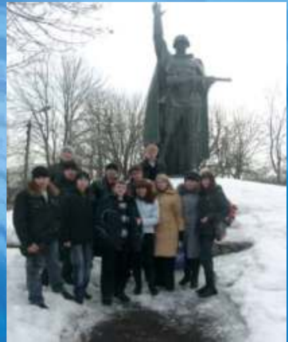
Командный пункт Центрального фронта