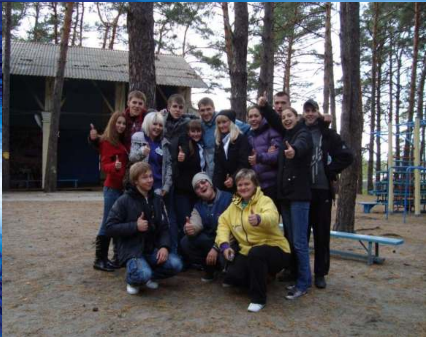
Вторые профильные сборы в Городском комплексном оздоровительно-досуговом центре детей и молодежи «Орленок»