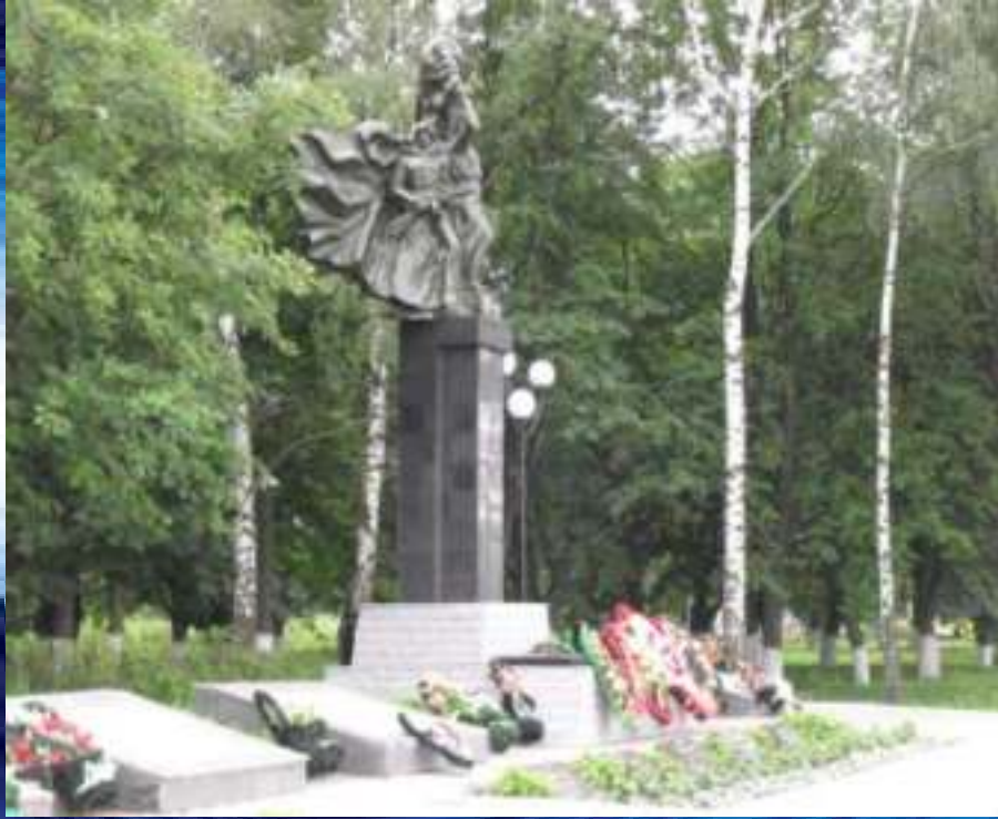
Северный Фас Курской дуги